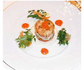
(上)海の幸とスモークサーモンのジュレアニス風味 トマトのクリームを添えて