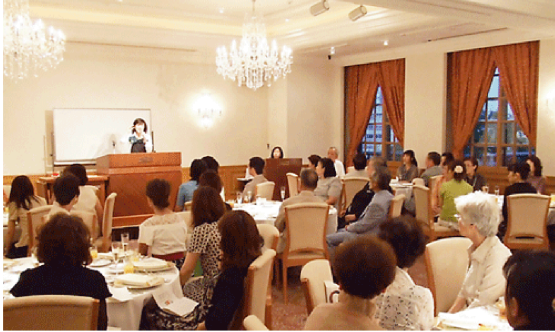
日本野菜ソムリエ協会講師 / 管理栄養士の中沢み先生による「美肌トーク」で盛り上がる、お食事前のひと時