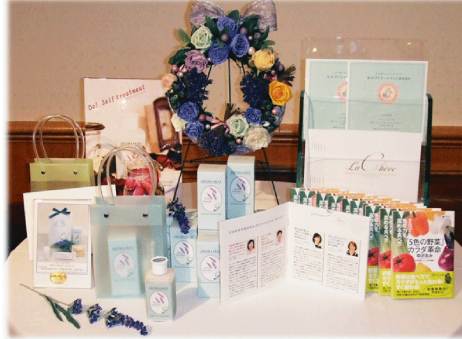
アトリエポプリ ハーブスクール主宰 鈴木良子先生による、ケフィアプロダクツディスプレイで会場「フローラ」が一層華やかに